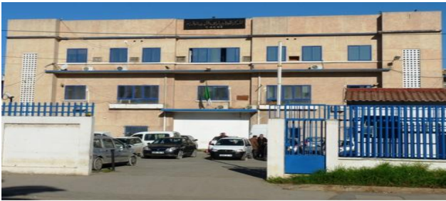
العنوان: الطريق الوطني رقم 5، ص ب 206 باب الزوار 5

— المركز الجزائري لمراقبة النوعية والرمز —