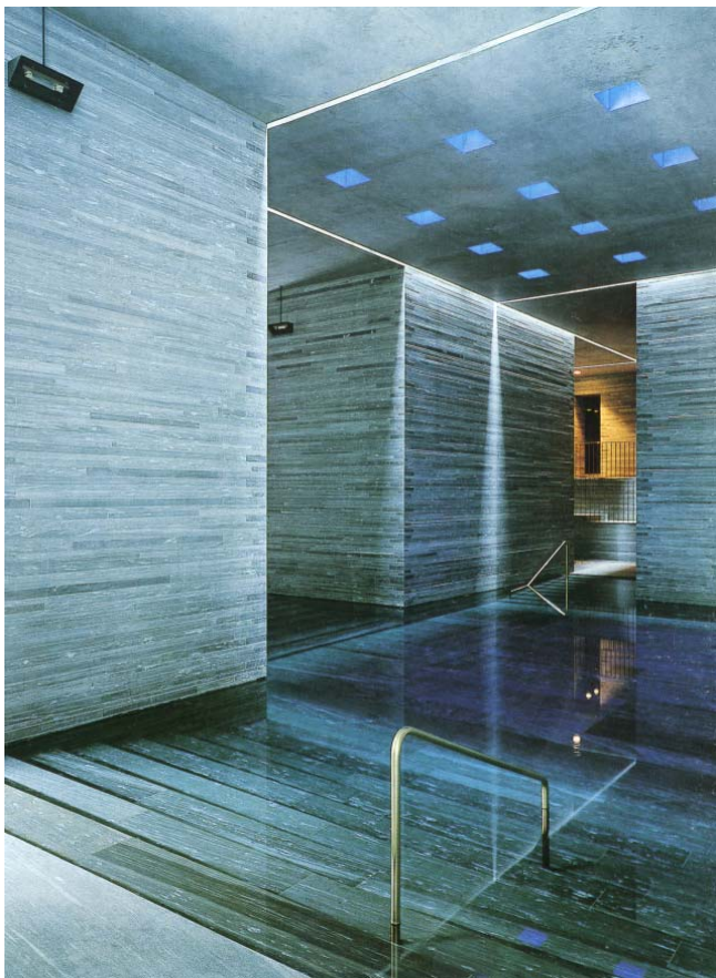
Figure 1: Vue intérieure des thermes de Vals, en Suisse, projet conçu par l'architecte Peter Zumthor

confort, et de la qualité de l'environnement en s'orientant vers un état d'âme 'hors normes' manifeste et en se focalisant sur l'expérience sensorielle ordinaire de l'espace architectural et/ou urbain. La notion d'ambiance intègre bel et bien ces aspects physiques au sein même de la notion d'usage, composante fondamentale de l'architecture telle que définie par Vitruve durant l'antiquité, et non pas en tant que dimension technique périphérique. Elle y associe les différents aspects inhérents à l'espace architectural dont [9] i) la variété et spécificité des conformations urbaines et architecturales, ii) les traits individuels et caractères socioculturels de l'utilisateur, iii) l'esprit du lieu (aspects climatiques, culturels...), et iv) les autres composantes de l'environnement (bruits, odeurs, fraîcheur...).