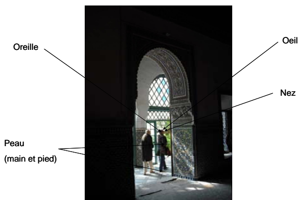
Figure.3: Identification des organes récepteurs à l'origine de la qualification de l'Ambiance

Pour une situation donnée, la qualification de l'ambiance au moyen de l'organe sensoriel résultera en cinq types d'ambiances selon l'organe-récepteur du signal (Figure 3, Tableau 1) : i) visuelle (œil), ii) olfactive (nez), iii) auditive (oreille), iv) tactile (peau), et v) gustative (la langue). Lorsque le signal est mis à l'avant (Figure 4, Tableau 2), et pour la même situation, il serait question de : i) lumineuse (lumière/ombre), ii) Odoriférante (odeur), iii) sonore (bruit), iv) thermique (chaleur/fraîcheur), v) aéraulique (vent), et vi) formelle (couleur, texture, ligne). La question posée concerne le choix du mode de qualification le plus approprié à l'architecture et sa pratique, en tant que domaine de recherche scientifique : organe sensoriel ou signal ?