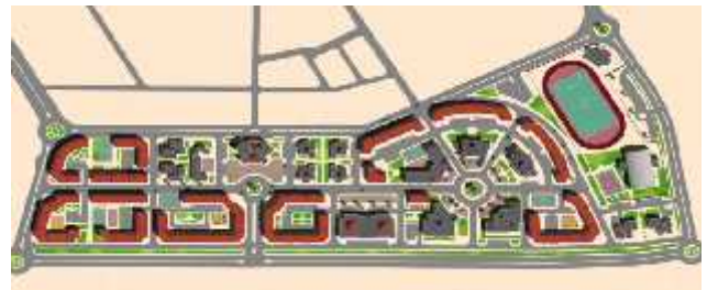
■ Habitat social collectif ■ équipement de proximité

Des tentatives çà et là ont eu lieu en vue d'améliorer les conditions de vie dans ces établissements humains. A Médéa, par exemple, des quartiers résidentiels ont subi une amélioration urbaine en les dotant d'espaces verts et d'équipements d'accompagnement. En ce sens, le quartier de Ksar El Boukhari, notre cas d'étude, est constitué de 775 logements pour accueillir 4650 habitants. L'habitat collectif a été construit en R+5, à l'image de l'ancien mode de planification. Les travaux ont démarré en 2007. La singularité de ce quartier d'habitat social réside dans l'adoption d'une mixité sociale et fonctionnelle. Cela éloignerait un tant soit peu de la conception de zoning de l'urbanisme moderne.